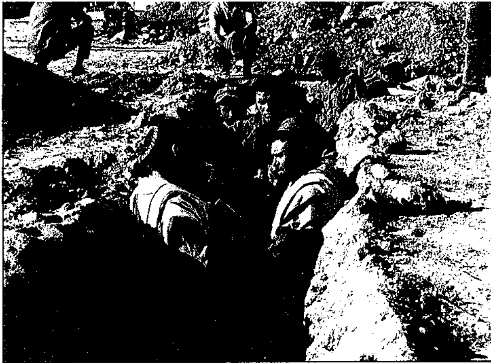
מלחמת יום הכיפורים, תחילה בחפירות

(מתוך 'אש', מאת יובל גרסה, 'זמירה ביתר', 1989)