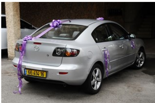
צעירים בישראל עומרי אילת ואילן כהן

כיוון שגיל הנישואים מתאחר וכיוון שבדור הזה לגיטימי יותר מאשר בדורות קודמים לגור יחד ללא נישואים, החתונה מגיעה במקרים רבים לאו דווקא מבחירת "האחד/ת והיחיד/ה", אלא משיקולים פרגמטיים יותר (לא תמיד מודעים) כגון: הלחץ להוליד ילדים (יותר אצל נשים), 1 הדחף להיות "כמו כולם", הרצון לרצות את ההורים והקרובים, וכדאיות כלכלית. 2